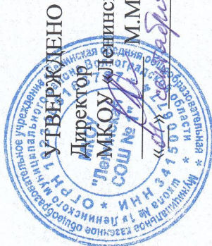
График посещения школьной столовой МКОУ «Ленинска СОШ № 1»